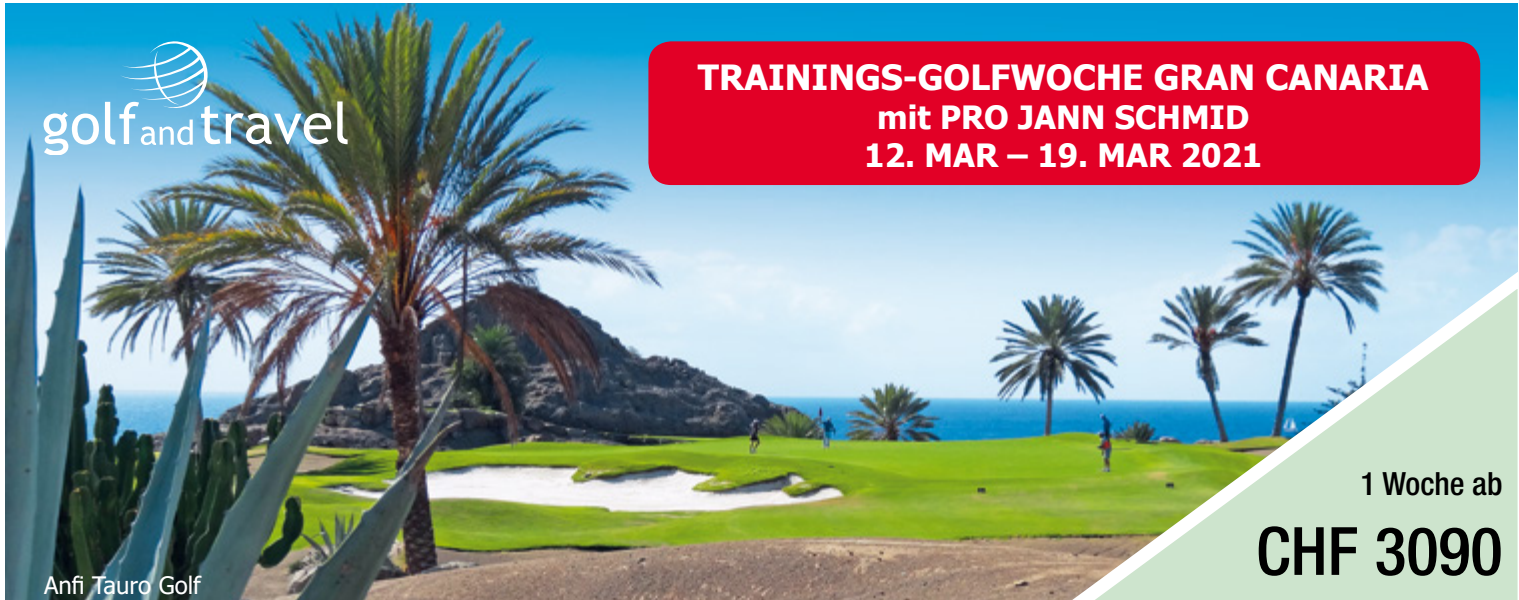
Anfi Tauro Golf